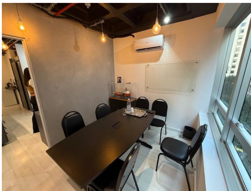
Figura 2 - Sala de Reunião