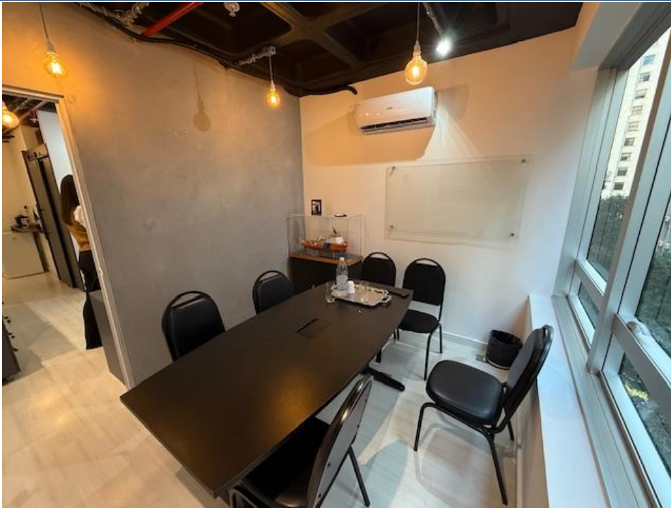
Figura 2 - Sala de Reunião