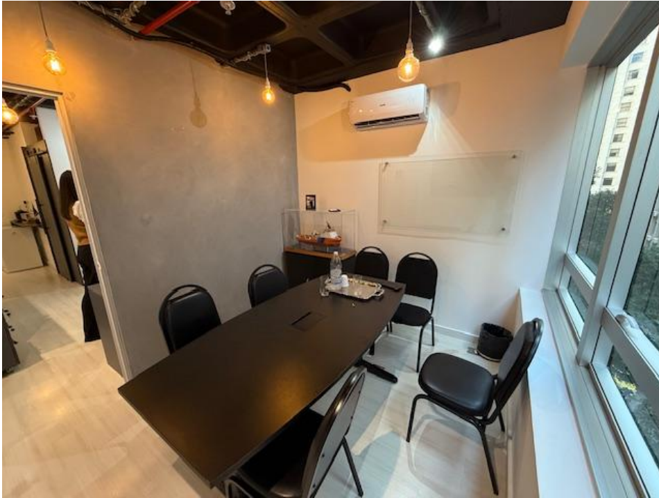
Figura 2 - Sala de Reunião