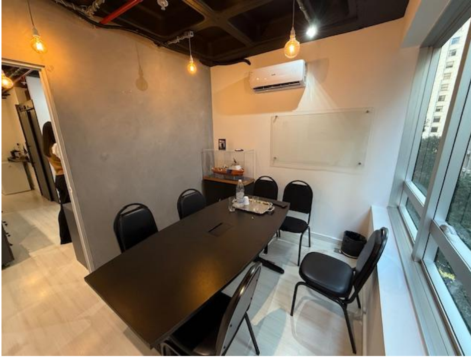
Figura 2 - Sala de Reunião