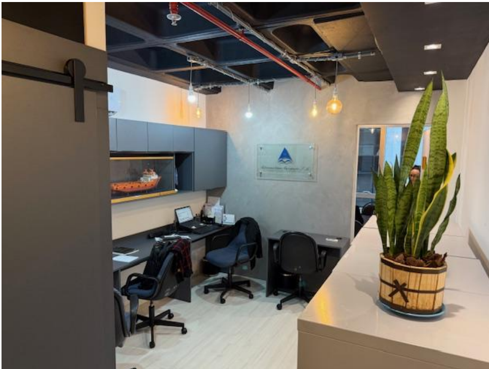
Figura 3 - Recepção