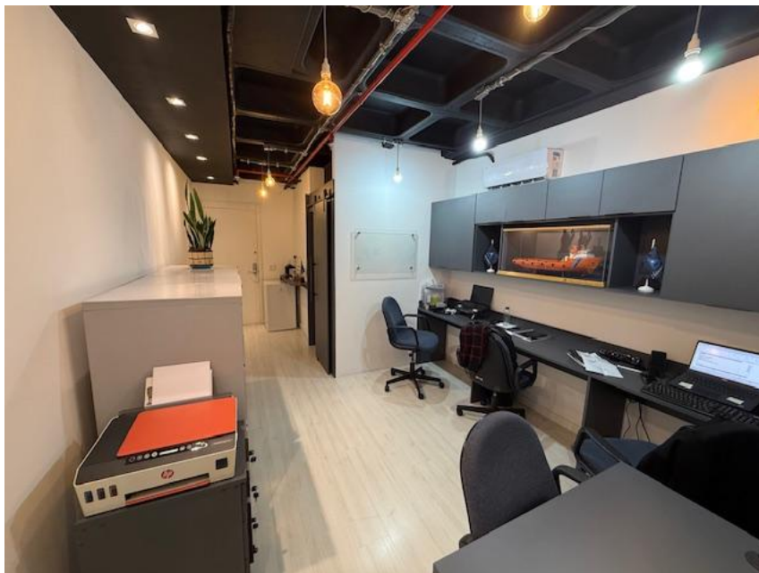
Figura 1 – Escritório